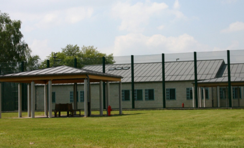
Centrum voor illegalen Vottem