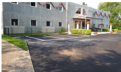
Centrum voor illegalen Holsbeek