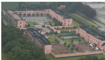
Centrum voor illegalen Merksplas